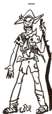
Muž s dobrodružnou minulostí

Muži, o nichž jsme prozatím hovořili, toužili po elegantním a rázovitým zevnějšku. Jsou však i zálesáci, kterým jsou tyto zženštilé snahy odporové, poněvadž pokládají kroj za