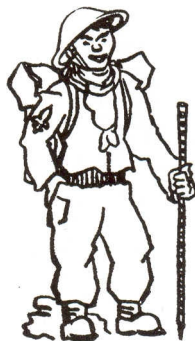
Lilie na rukávu dokazuje, že jde o skauta, a ne člena anglických commandos.

Těmto mužům se zdánlivě podobají výjimečně nadané osobnosti, pro něž je kroj jakési muzeum slavných činů a jejich skromný pomník. Podobnost je však čistě náhodná, neboť zatímco u vojensky zteplilých elegantů je kroj hlavní věcí, tady je úplně podřadný, ba zbytečný, protože mizí pod záplavou' odznaků a vyznamenání. Úloha kroje je u nich přesně stejná jako úloha vitríny v muzeu: vystavovat sbírky na obdiv.